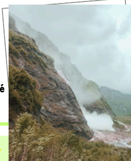
Avalanche filmée le 5 Juin 2021 secteur Fond de la Combe